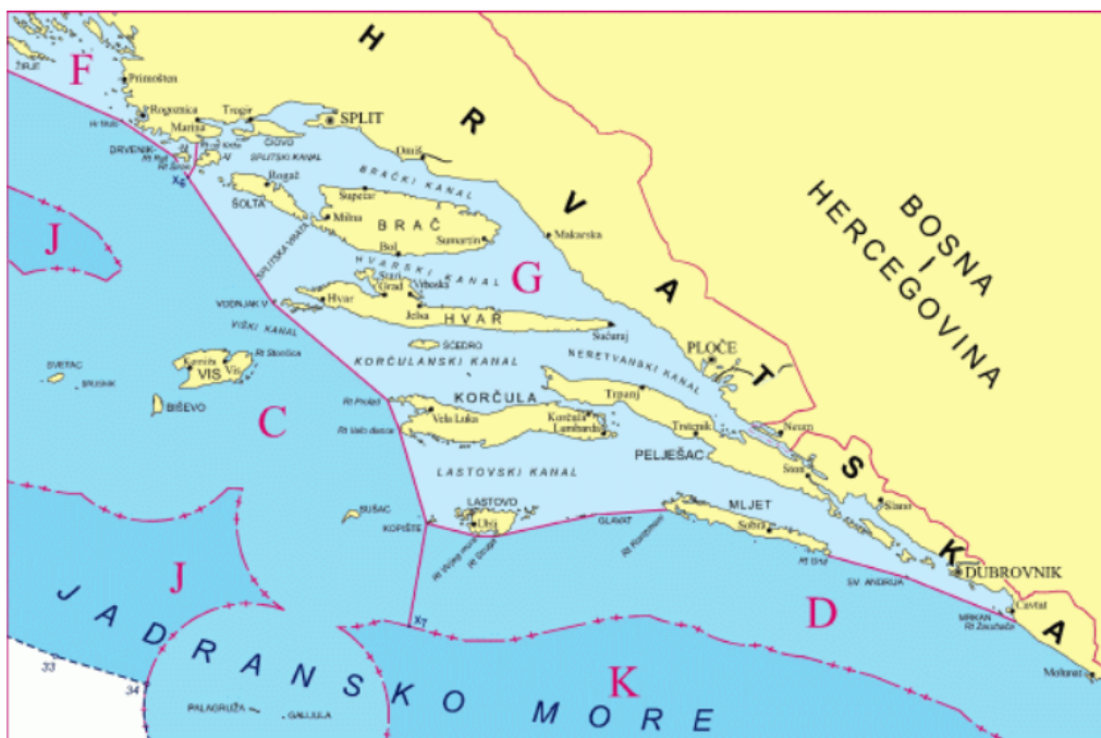
Slika 2 Ribolovne zone FLAG područja